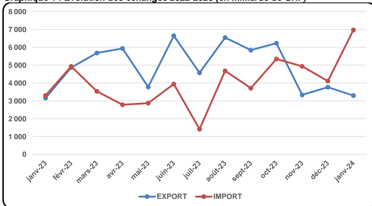
Graphique 1 : Evolution des échanges 2022-2023 (en milliards de GNF)

Les importations de la Guinée, en janvier 2024, sont estimées à GNF 6 972,6 milliards, contre GNF 4 106,7 milliards au mois de décembre 2023, soit une augmentation de 69,8 %. Cette hausse est principalement expliquée par celle des achats à l'extérieur des bateaux phares, dragues; docks flottants; plates-formes de forage flottantes (qui sont passées de GNF 20,2 milliards en décembre 2023 à GNF 1 264,8 milliards en janvier 2024), des remorqueurs et bateaux-pousseurs (qui sont passées de GNF 65,1 milliards en décembre 2023 à GNF 857,6 milliards en janvier 2024), des éléments de voies ferrées, en fonte, fer ou acier (GNF 47,0 milliards en décembre 2023, contre GNF 98,1 milliards en janvier 2024), des voitures de tourisme (+41,5 %) et des produits pétroliers (+32,5 %). Par ailleurs, la baisse des importations des véhicules automobiles (-27,6 %), des machines du BTP (-23,2 %) et des motocycles (-19,7 %) a essentiellement freiné cette augmentation. Par rapport au mois de janvier 2023, les importations ont plus que doublé (+111,2 %).